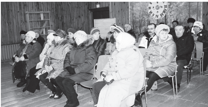
▲ Большинство жителей с нетерпением ожидает появления газа в своих домах

На протяжении встречи сельчане задавали интересующие вопросы. Они касались стоимости подключения к газопроводу, размеров охранной зоны и того, что делать, если в эту зону попадают инженерные коммуникации. Интересовались и тем, не будет ли во время прокладки газо-