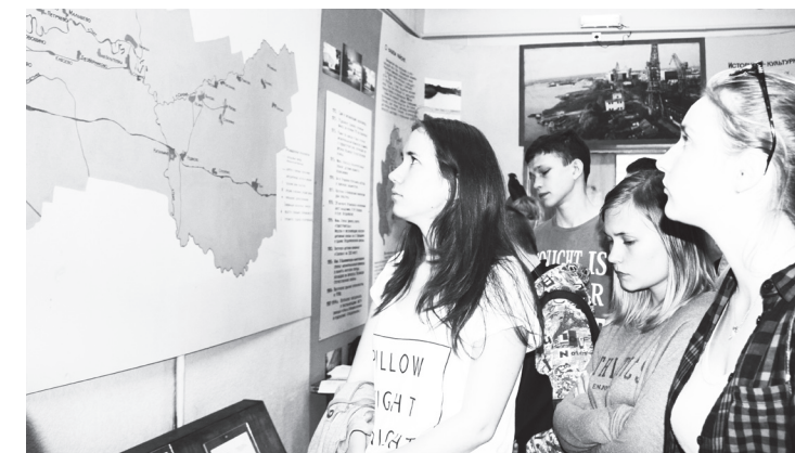
▲ Студенты Нижегородского радиотехнического колледжа в навашинском музее

– Все выходные я провел здесь. Гулял по Нижнему Новгороду: был в Кремле, спускался на набережную – там прекрасные церкви. Я съездил в Городец, и меня восхитили местные пряники, – заявил профессор Дублинского университета, крупнейший мировой специалист в области маркетинга Луиж Моутиньо, читавший недавно лекции в одном из нижегородских вузов.