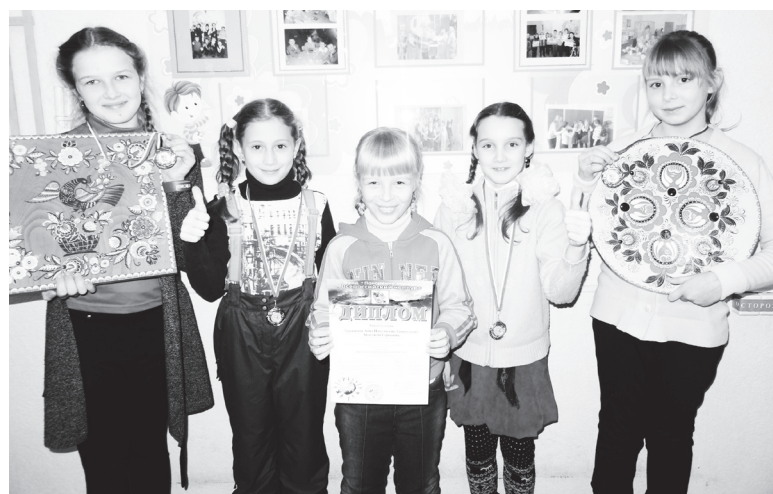
▲ Участницы творческого объединения «Городецкие узоры»: «В работу мы вложили старания и любовь»