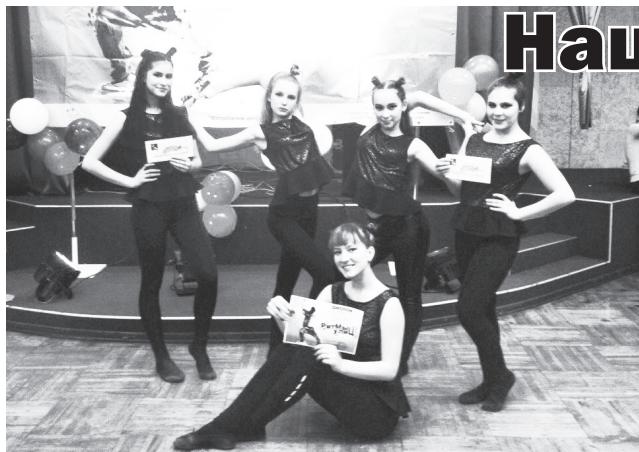
▲ «Апельсин» представлял вог - стиль танца, основанный на модельных позах