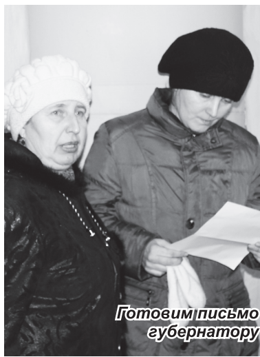
Готовим письмо губернатору