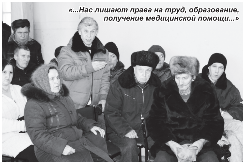
«...Нас лишают права на труд, образование, получение медицинской помощи...»