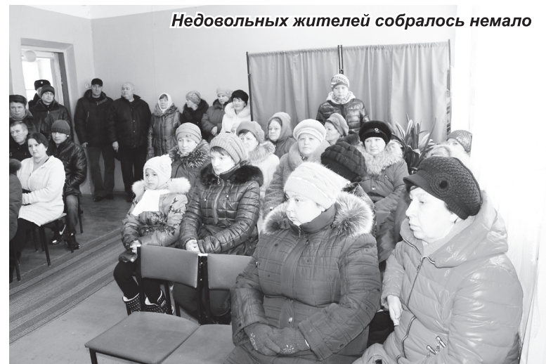
Недовольных жителей собралось немало