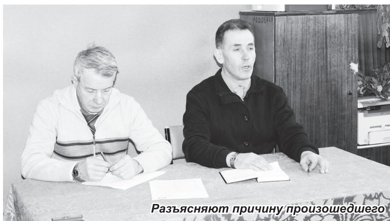
Разъясняют причину произошедшего