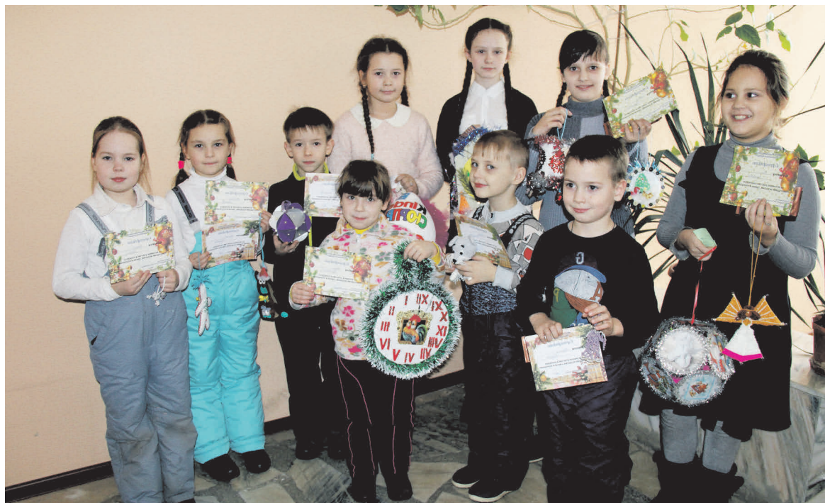
▲ Участники конкурса