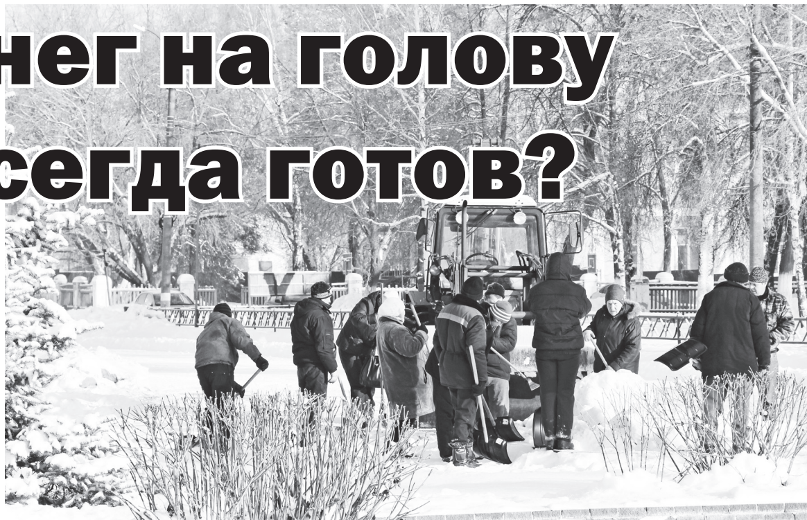
▲ Ручная и механизированная работа по уборке снега