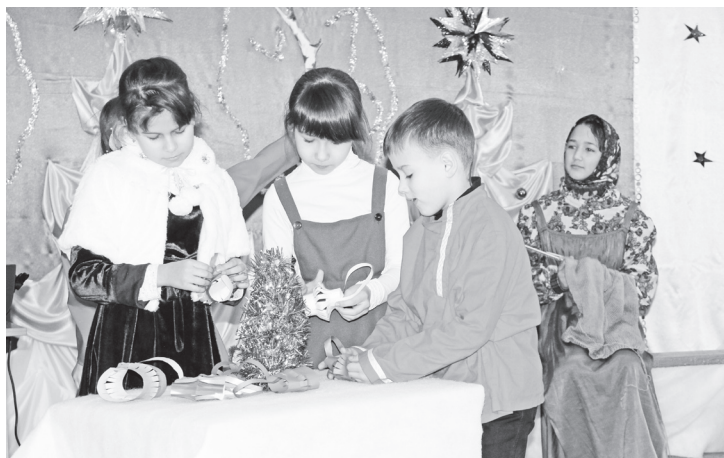
▲ Учащиеся Большеокуловской школы со спектаклем «Святое Рождество»