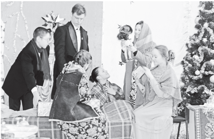
▲ Постановка «Рождество - семейный праздник» творческого объединения «Театральная азбука» ДДТ

На суд жюри были представлены мини-спектакли о великом событии Рождества Христова. Ярким этапом мероприятия стала программа постановок, подготовленная воспитанниками детских садов, Дворца детского творчества, Навашинского центра дополнительного образования детей городского округа Навашинский, а также учащимися Большеокуловской и Поздняковской школ. Ребята со всей ответственностью подошли к подготовке: разучивали роли, долго репетировали, с помощью педагогов старались ярче раскрыть сценические образы. В исполнении артистов были показаны постановки: «Евангельская история о рождении младенца Христа», «Рождество – семейный праздник», «Традиции праздника Рождества Христова», «Святки – вре-