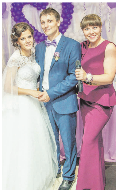
▲ На проведении торжества у семьи Карповых

Ксения ПИСКУНОВА