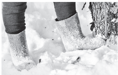
▲ Оттапывание снега вокруг деревьев, обвязка стволов помогут пережить нашествие грызунов

Кроме того, в дни февральских оттепелей следует остерегаться очередного нашествия мышей-полевок. Начинается оно с середины месяца и продолжается до конца марта, пока снег полностью не пропитается водой. До той поры грызуны легко прокапывают в нем длинные ходы-тоннели к молодым яблоням и грушам, объедают с них кору, после чего деревца часто погибают. Спасает регулярное оттапывание снега вокруг таких посадок, обвязка стволов колючими еловыми ветками, а также и раскладывание рядом с деревьями специальных приманок «ЭФА».