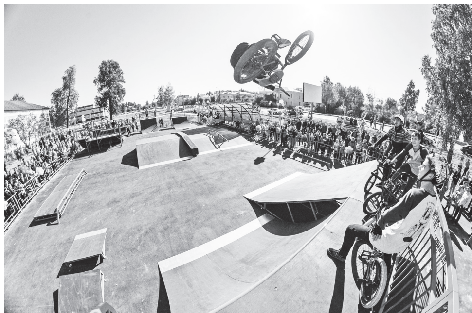
▲ Скейт-парк в Первомайске