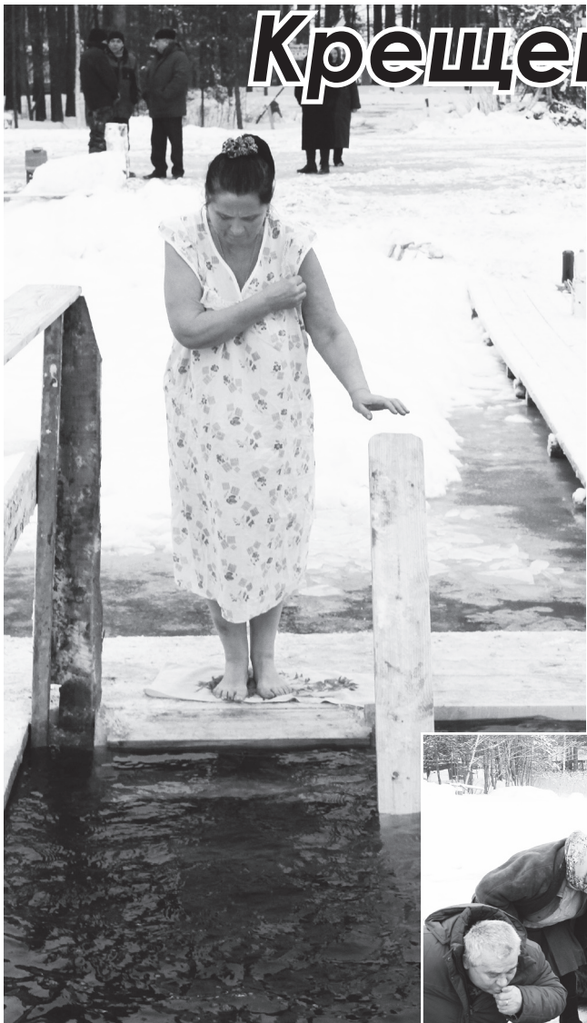
▲ Первое омовение в иордани на озере Святое Дедовское

Особенность Крещения - великое освящение воды. К ней христиане с древних времен имеют особое благоговение, употребляя для исцеления и укрепления душевных и телесных сил. Но, как говорят сами священнослужители, окунуться в прорубь - дело добровольное, но именно крещенская купель с каждым годом привлекает все больше людей. В Крещенский сочельник мы присутствовали на озере Святое Дедовское при чине Великого освящения воды в купели, где сразу же нашлись желающие окунуться в нее.