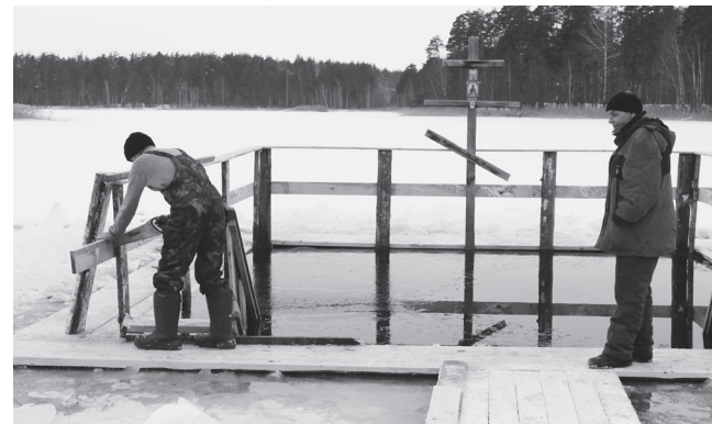
▲ Последние штрихи

После того, как батюшка последний раз с молитвой окунул в прорубь крест, присутствовавшие при освящении воды умылись ею и сделали несколько глотков. Сразу же нашелся смелый мужчина, который захотел