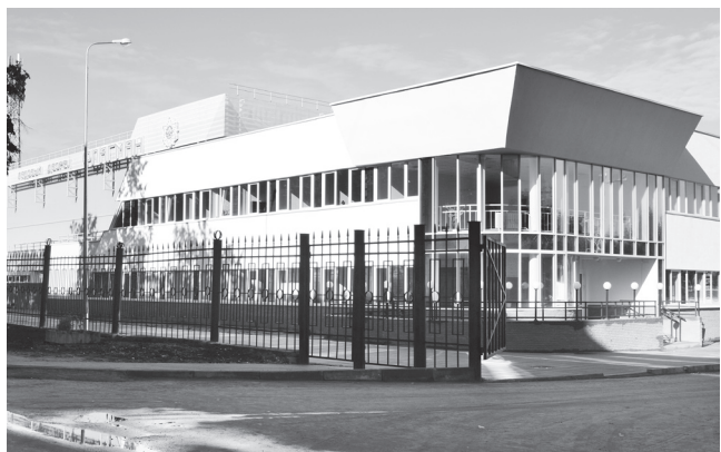
▲ Ледовый дворец в день торжественного открытия

Одним из приоритетных направлений деятельности органов власти регионального и муниципального уровня в Нижегородской области является благоустройство территорий. В этом году уже в десятый раз проводился смотр-конкурс на звание «Лучшее муниципальное образование Нижегородской области в сфере благоустройства и дорожной деятельности», в котором участвовал и наш округ. Об итогах конкурса зашла речь на едином информационном дне, который состоялся в четверг.