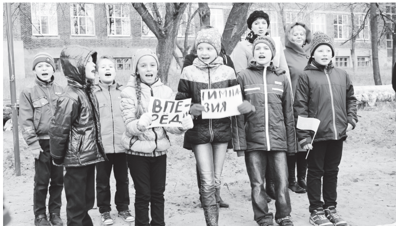
▲ Активно бодем за своих и ненапрасно