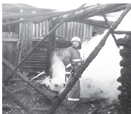
▲ 21 человек участвовал в тушении пожара

Оба сгоревших дома были жилыми. И лишь один, наименее пострадавший от пожара дом №58, в котором обгорела стена и кровля надворной постройки, использо-