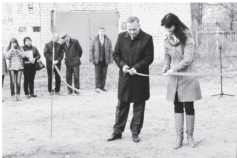
▲ Открытие состоялось! Радостный момент для школы

- Выходя на конкурс с проектом «Открытый кубок по футболу им. Александра Дядюшкина» нами двигала идея увековечения