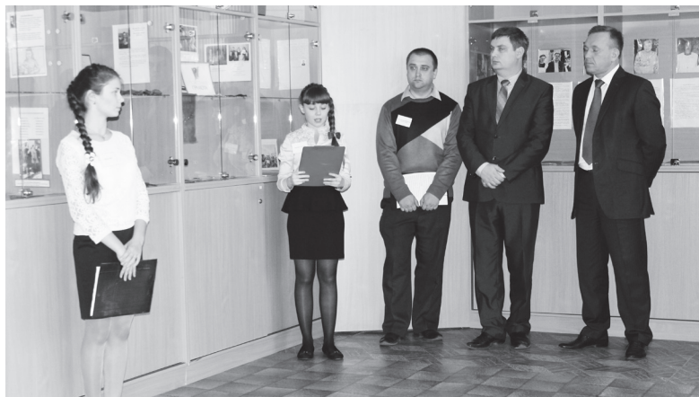
▲ Первая экскурсия по обновленному музею