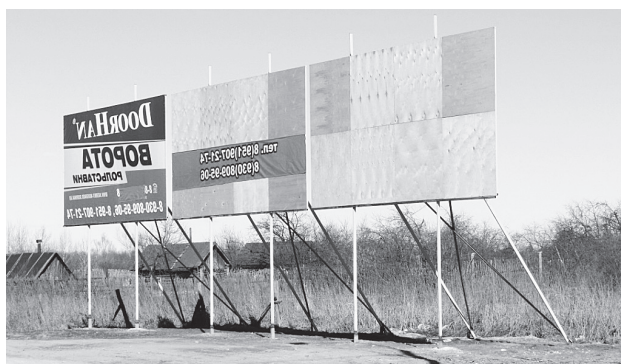
▲ На конструкции должны быть разрешающие документы

Также на сайте администрации размещены торги по