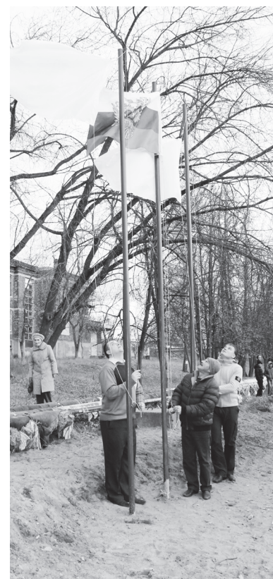
▲ Российский триколор на почетном месте