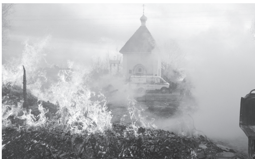
▲ Деревянные дома сгорели быстро