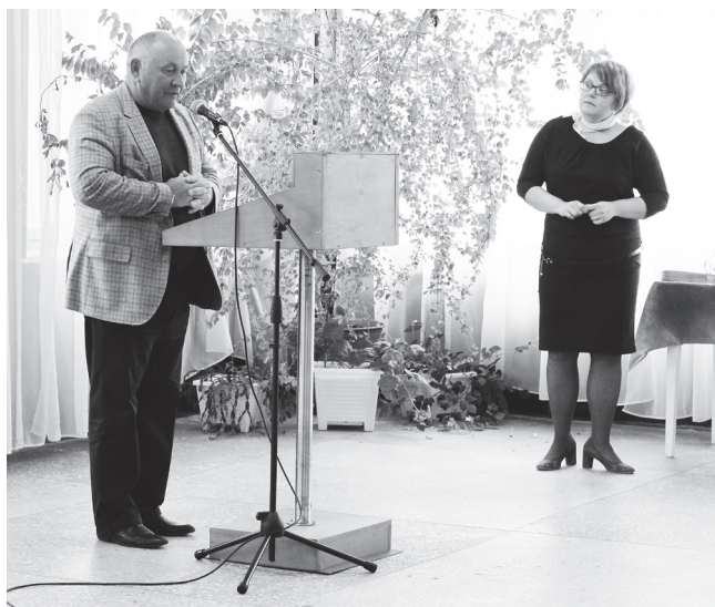
▲ «Мы и дальше будем осуществлять поиск новых заказов»

Окской судовой верфи исполнилось 108 лет