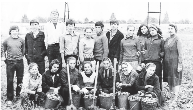
▲ На пришкольном участке в 1976 году