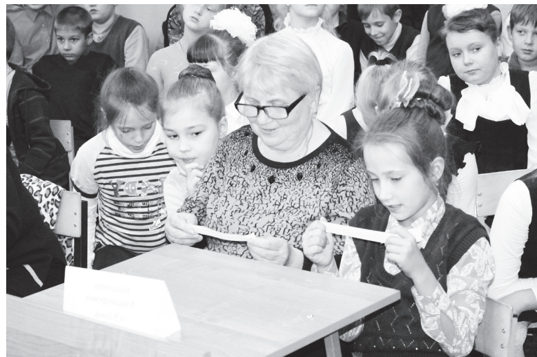
▲ Угадать рецепт не так-то просто!

Далее команды бабушек и внуков состязались в конкурсах. Ведущая зачитывала легенду, а