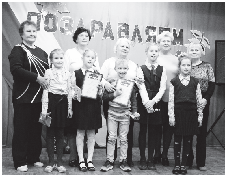
▲ Участники конкурса - на сцене