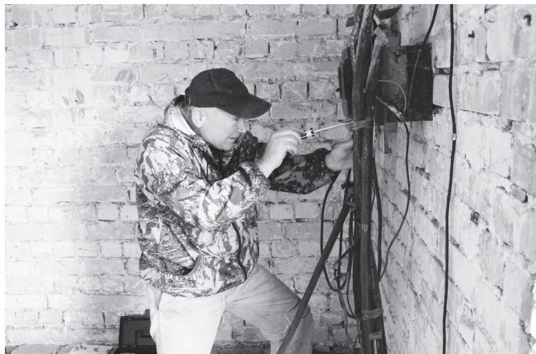
▲ Подключение генератора