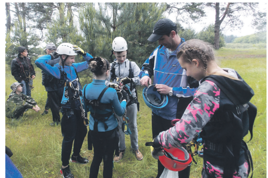
▲ Подготовка снаряжения, проверка спортивного оборудования - работа кропотливая, но важная

19 и 20 июня, близ деревни Малышево проходили традиционные муниципальные соревнования по спортивному туризму и ориентированию «Костер у янтарной сосны». В соревнованиях участвовали как «бывалые» туристы из школ №№2, 3, Поздняковской, так и «начинающие» - из Натальинской школы.