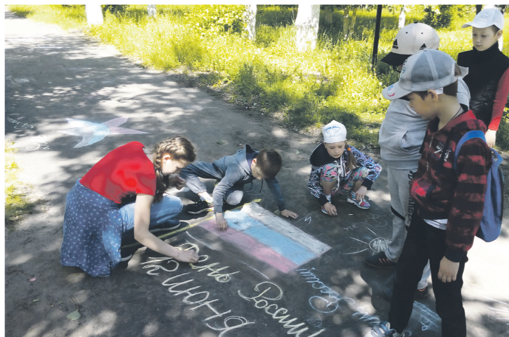
▲ Быть командой, делать общее дело - здорово!