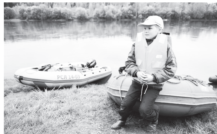
▲ Обязательное условие нахождения ребенка на борту маломерного судна – наличие жилета

Павел СЕРГЕЕВ, государственный инспектор Навагинского участка ГИМС