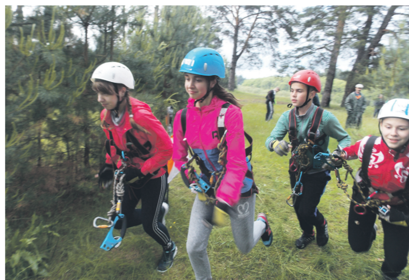
▲ Туризм - спорт для всех, заряд оптимизма - гарантирован

А итоги двух соревновательных дней оказались такие: 1 место - у коман-