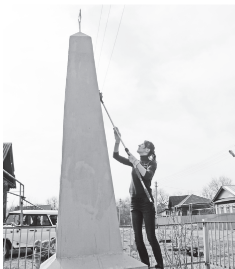
▲ Сотрудники редакции на благоустройстве памятника в с.Спас-Седчено