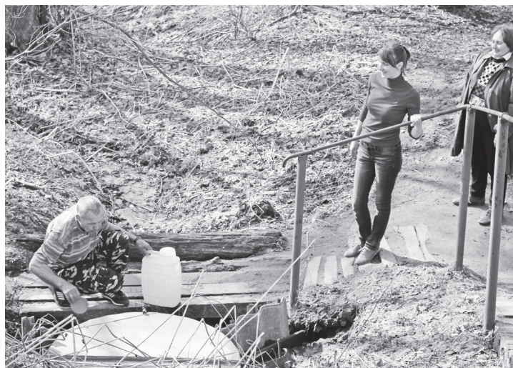
▲ У родника в Спас-Седчене

21 апреля – День местного самоуправления