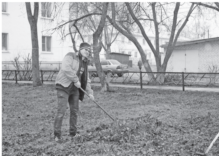
▲ На улице 50 лет Октября. Трудятся работники МКУ «Управление дорог»