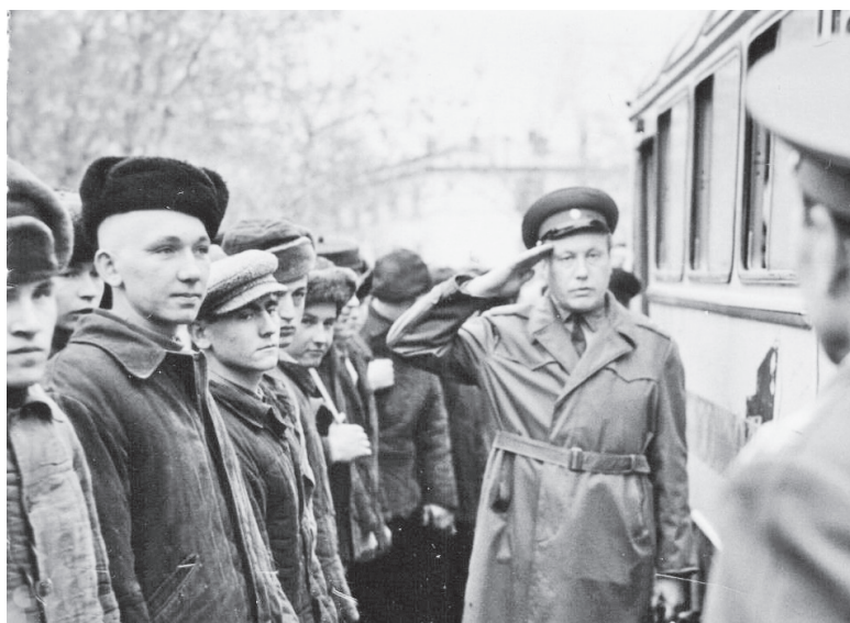
▲ Докладываю военкомату: «Команда призывников построена»