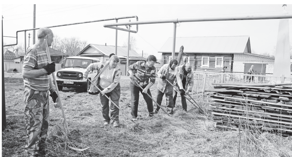
▲ К уборке памятника в с.Спас-Седчено присоединились и работники «Управления дорог»