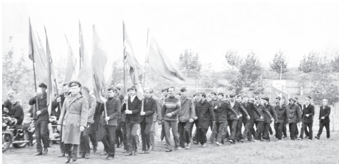
▲ Торжественный марш призывников