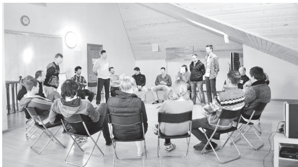
▲ В Нижегородской области действуют государственные и некоммерческие организации, работа которых направлена на помощь в реабилитации и ресоциализации наркозависимым

2. Некоммерческими организациями (реабилитационными центрами), зарегистрированными в установленном порядке в соответствии с законодательством