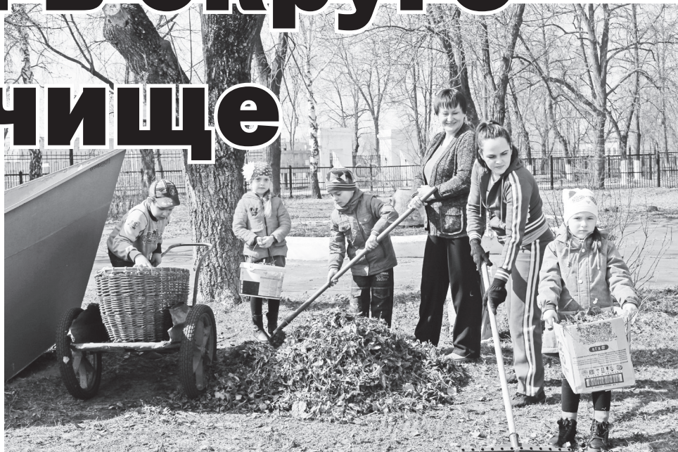
▲ – Мы хотим, чтобы наш участок был чистым, – пояснили малыши