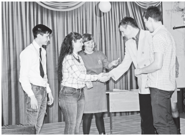
▲ Церемония награждения победителей и участников молодежного форума

Так назывался первый муниципальный молодежный форум, который прошел 12 апреля на базе Навашинского политехнического техникума. В рамках этого мероприятия студенты и учащиеся общеобразовательных организаций городского округа Навашинский представляли свои инновационные проекты по самым разным тематическим направлениям.