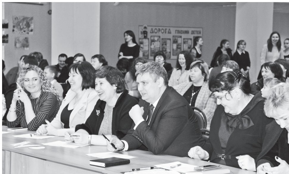
▲ Жюри оценивает работу конкурсантов

Навашинский есть достойные учителя-профессионалы. Сегодня – финал. Все волнуются. Я желаю участникам финала показать свое мастерство, представить свое образовательное учреждение! Желаю вам никогда не останавливаться на достигнутом и ставить перед собой все новые задачи. Пусть работа приносит вам удовлетворение и радость!