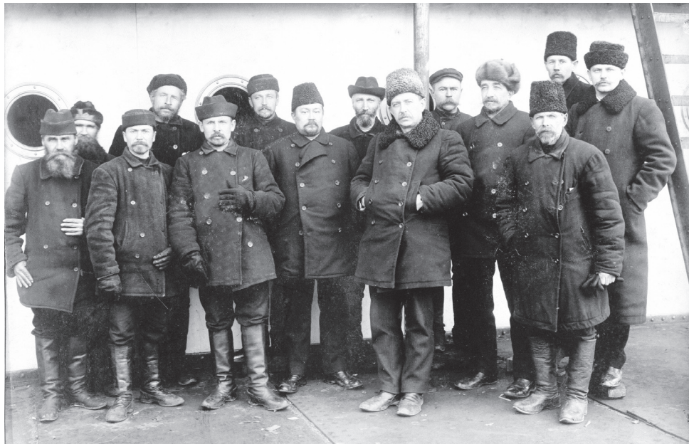
◀ Группа руководителей строительством – на палубе шхуны