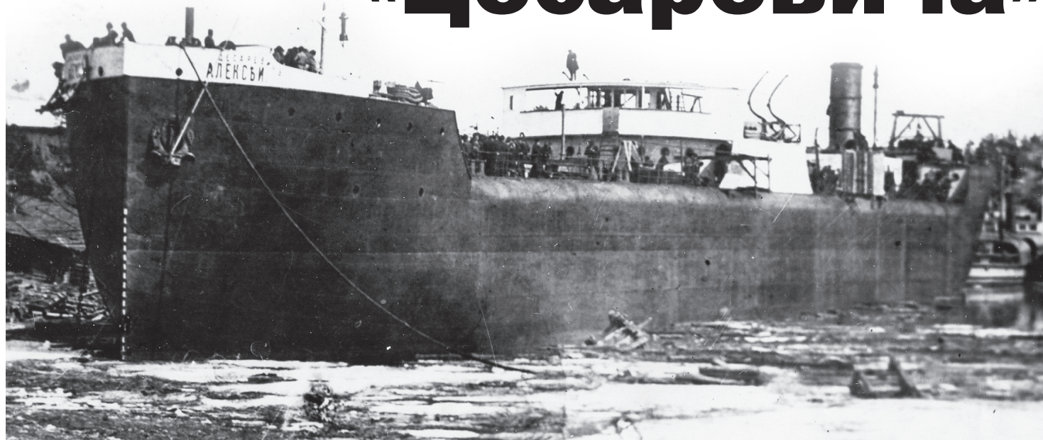
▲ «Цесаревич Алексей» на воде (апрель 1912 года)