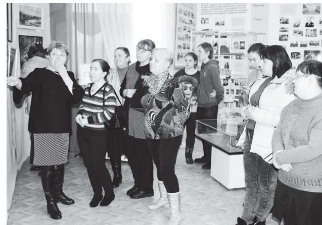
▲ В историко-краеведческом музее

В настоящее время Гагаринские чтения – это масштабный форум, направленный на увековечивание памяти Юрия Гагарина, популяризацию достижений отечественной космонавтики и научно-технических знаний в молодежной среде, исследование роли и значения первого полета человека в космическое пространство, обсуждение проблем и перспектив современной космонавтики.