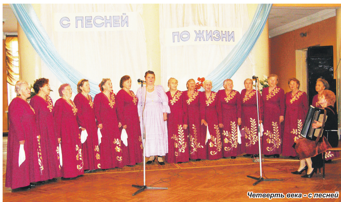
Четверть века - с песней