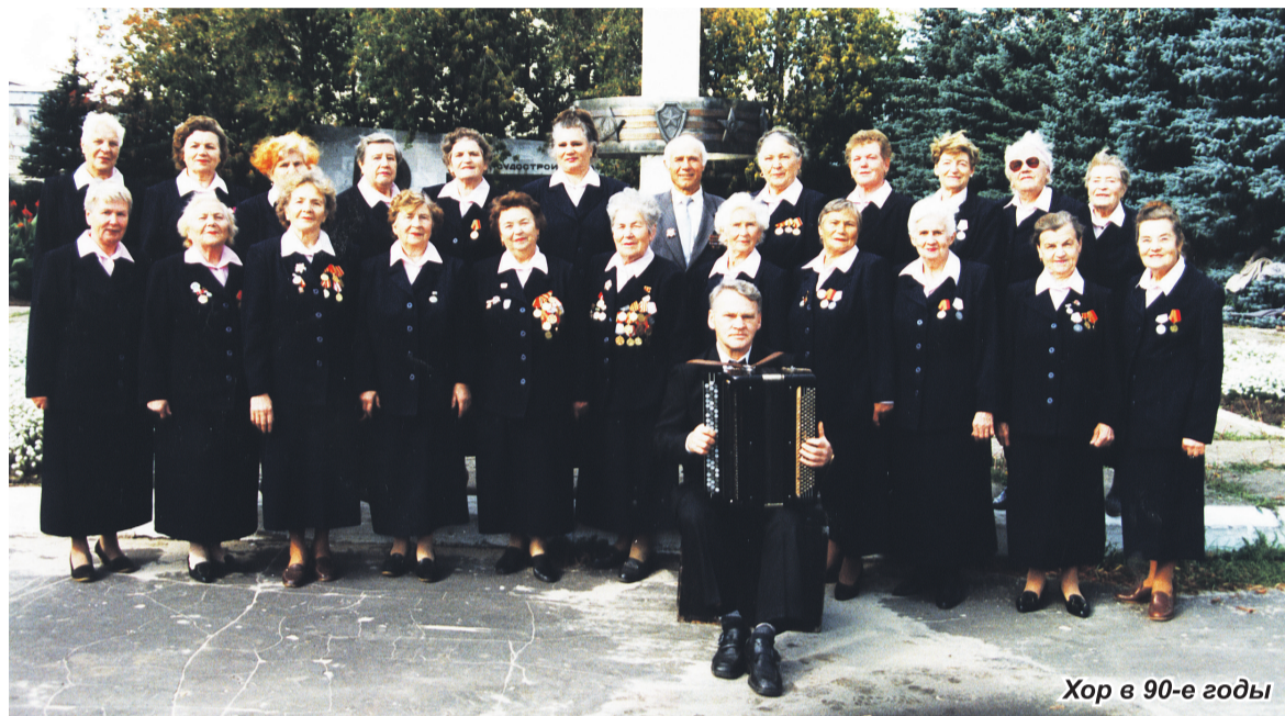
Хор в 90-е годы

В таком составе на протяжении длительного времени хор выступал не только во Дворце культуры и на площадках города и района, но и на сценах Нижнего Новгорода. И везде народный хор ветеранов был желанным гостем. В исполнении хора звучали песни русских и советских композиторов и поэтов о ВОВ, мире, труде, земле, традиционные русские народные песни,