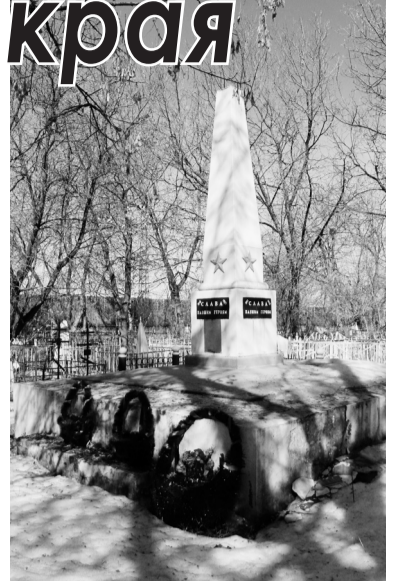
Братская могила воинов, умерших от ран в госпитале

Братская могила была сооружена в 1958 году в память о тяжело раненных фронтовиках, которых не удалось спасти. Даже спустя столько лет, этот мемориал сохранился в хорошем состоянии. Возле могилы чисто, стоят свежие венки. Обязанность по уходу за братской могилой лежит на МБУ «ЖЭК, благоустройство города Навашино». Этот мемориал к 9 Мая также ждет косметический ремонт.