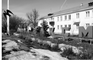
Обелиск комсомольской славы

Задача ухаживать за памятником и поддерживать его в надлежащем состоянии лежит на МУК «Дворец культуры» и библиотеке «Обслуживание». Прибыв на место, мы убедились, что за мемориальным комплексом действительно ухаживают, на территории домика прибрано, да и сам он находится в хорошем состоянии, обелиск, несмотря на близкое расположение к дороге, также облагорожен.