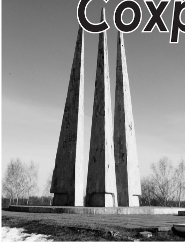
Мемориал погибшим в годы Великой Отечественной войны

А она у Навашина богатая. Подтверждением этому являются многочисленные памятники. И сейчас важно сберечь их для потомков. В преддверии Международного дня охраны памятников и исторических мест мы решили проверить, в каком состоянии они находятся и какие принимаются меры по их сбережению.