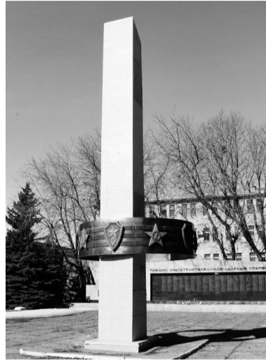
Мемориал погибшим судостроителям