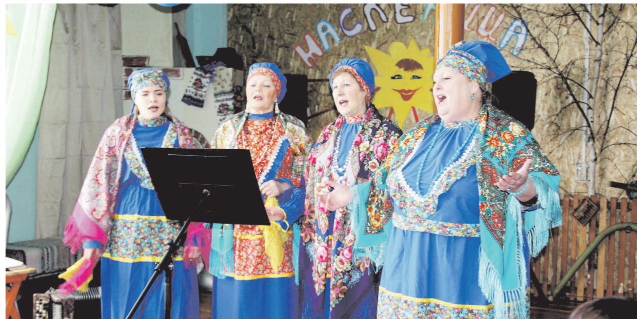
▲ Вокальный коллектив «Калинка» Сонинского СДК