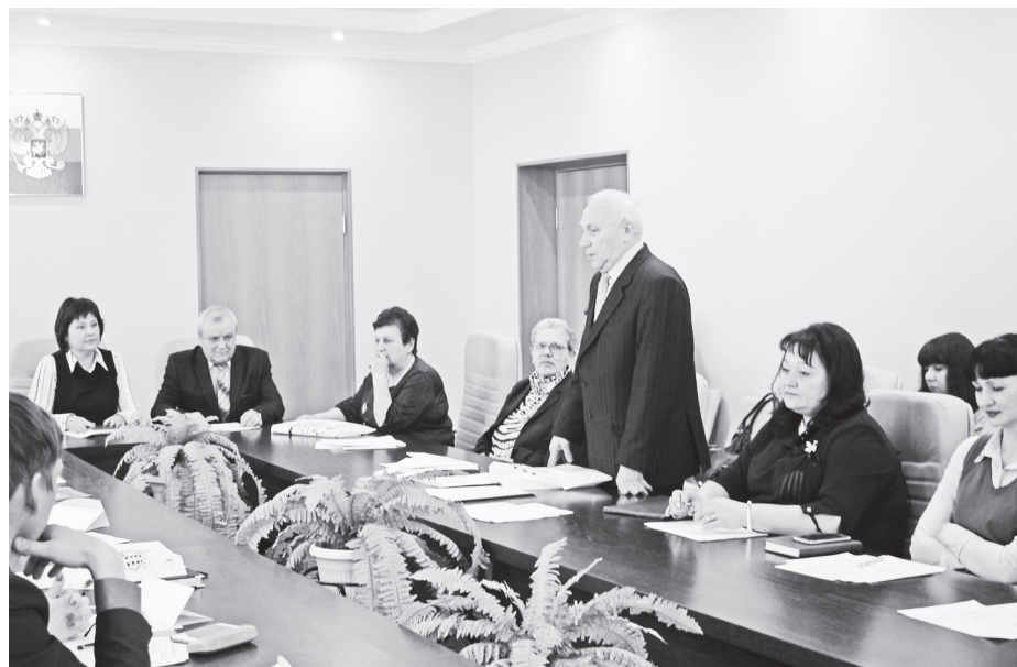
▲ Проблемы детей и детства необходимо решать сообща

Каждый из состава КДНиЗП, от председателя до рядового члена, душой болеет и переживает за ребенка, его семью. Каждую подростковую драму воспринимает как свою личную. А их достаточно было и есть в любые времена: пропуски учебы, неудовлетворительное поведение в общественных местах, распитие спиртных напитков, переход в неподобающем месте проезжей части, железнодорожных путей, ненадлежащее исполнение родительских прав родителями, жестокое обращение с детьми. Комиссия борется за каждого подростка, подходит к любому вопросу с позиции «не навреди», пытается найти положительные стороны характера даже самого «отпетого» хулигана, внутренне оправдать, войти в положение.