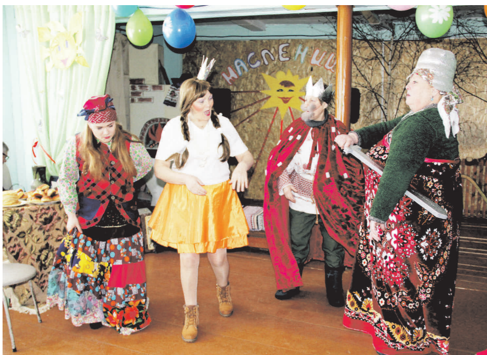
▲ Импровизация сказки «Как царевна жениха выбирала»