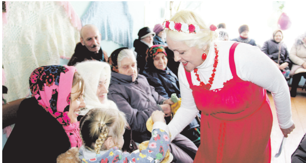
▲ Активных участников угощали блинами