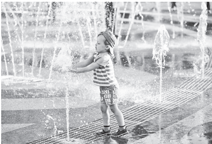
▲ Пешеходный фонтан на радость детворе

Общим числом голосов членов комиссии было принято решение о том, что рейтинговое голосование следует провести 18 марта с 8.00 до 20.00 на 8 счетных участках, организованных в школах №№ 2 (1 этаж, каб. № 6), 3 (1 этаж, каб. № 11), 4 (1 этаж, каб. № 3), гимназии (актовый