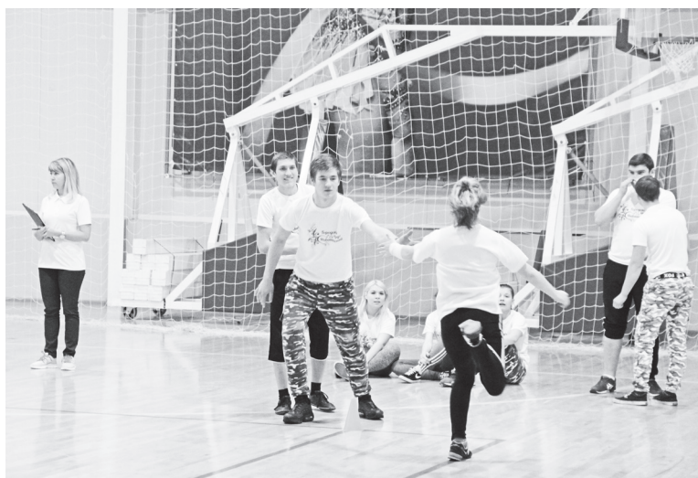
▲ Занять делом – уберечь от правонарушений

Комиссия сотрудничает с Линейным пунктом полиции станции Навашино, Линейным отделом полиции станции Муром с целью