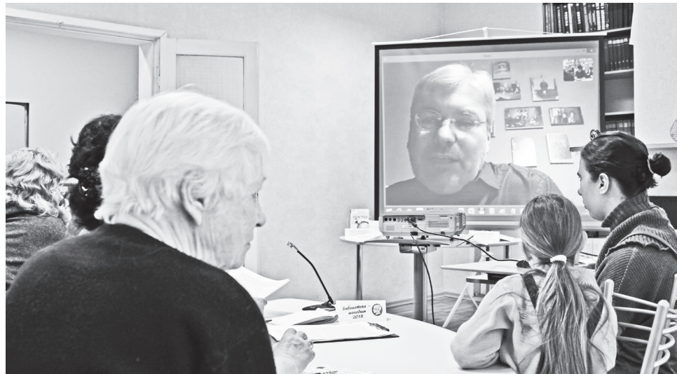
▲ В процессе общения с писателем

Однако своего рода творческим литературным дебютом сам автор считает роман «Соловьев и Ларионов», выпущенный в 2009 году. Он стал финалистом премии Андрея Белого в 2009 году и «Большой книги» в 2010 году. Произведение представляет научную жизнь в самых разных, порой весьма неожиданных ее проявлениях.