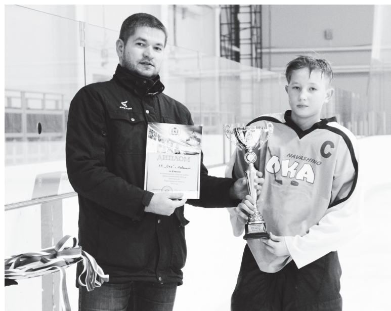
▲ Вице-президент Нижегородской областной федерации хоккея вручает награды