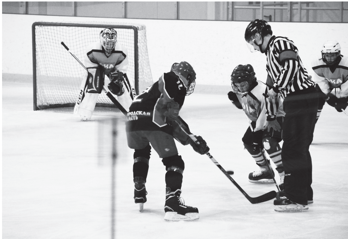
▲ Подача шайбы. В финальной схватке – «Ока» и «Сеченово»

– Мы стремимся к тому, чтобы праздник хоккея приходил в разные районы области. Поэтому если поступят заявки от районов, в которых ни разу не проводился областной этап Всероссийских соревнований «Золотая шайба», их рассмотрим в первую оче-