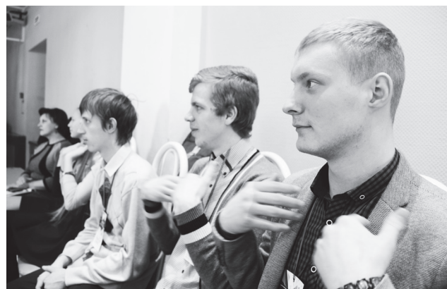
▲ Студенты Навашинского политехнического техникума. Секция «Развитие волонтерского движения»

– Перед созданием проекта молодежная палата при Совете депутатов определила основные задачи: сформировать любовь к родному краю, показать возможности для саморазвития, мотивировать старшеклассников на возвращение в округ, познакомиться с рынком потребностей в трудовых ресурсах,