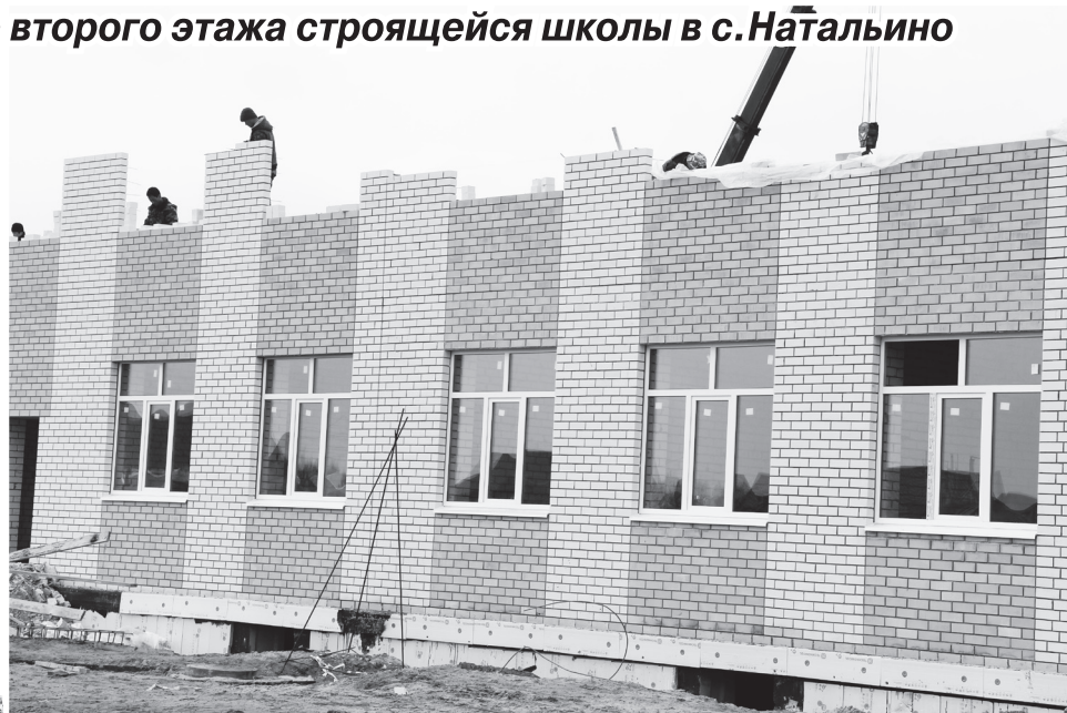
▲ Перекрытие 2-го этажа будет выполнено в этом месяце