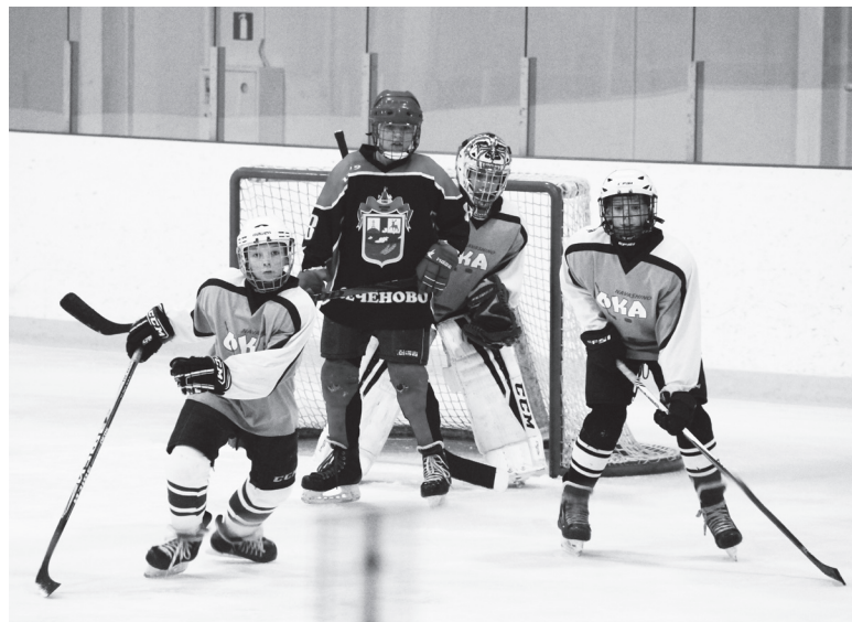
▲ Наши держали оборону до последнего