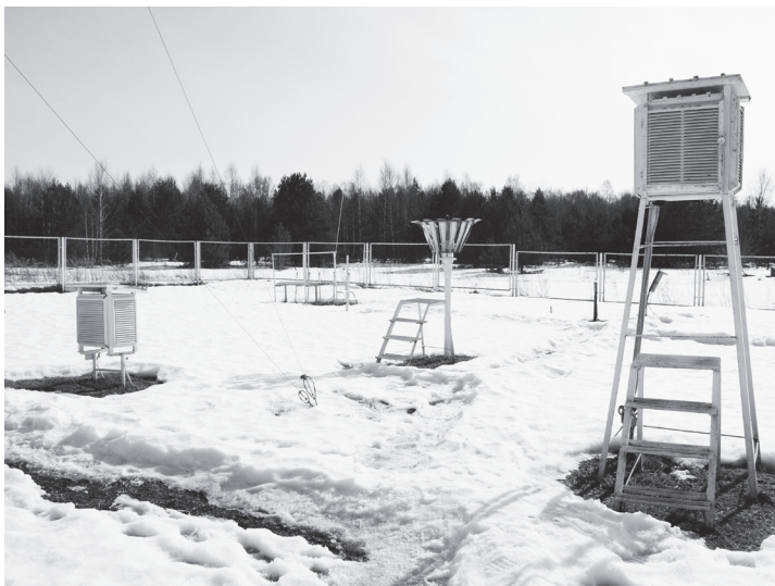
▲ Метеостанция в с.Монаково

Екатерина ЗАРЕЦКАЯ