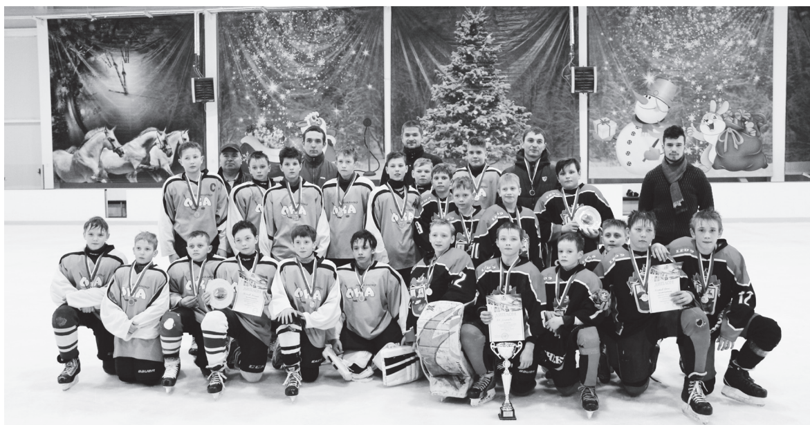
▲ После церемонии награждения. Обладатели золотых и серебряных медалей областного этапа Всероссийских соревнований «Золотая шайба»