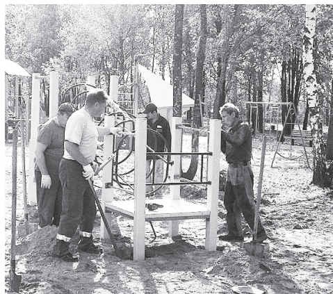
▲ На радость детям