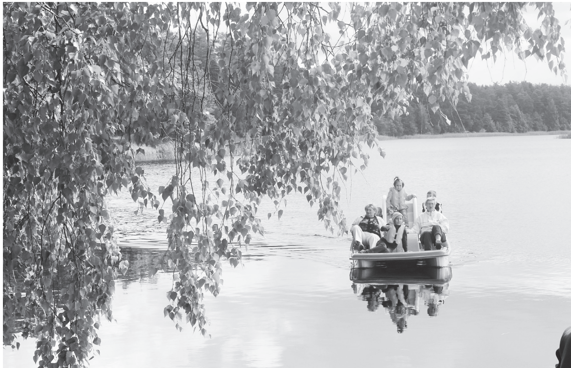
▲ По тихой глади озера Свято