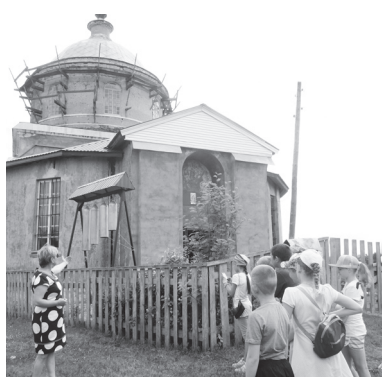
▲ С экскурсией в Поздняково

Словом, потенциал нашего края действительно огромный.