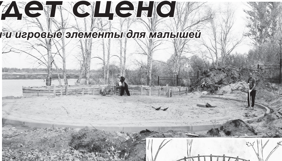
▲ Главное - успеть в срок

В наших планах установить еще несколько игровых элементов на существующей детской площадке для малы-