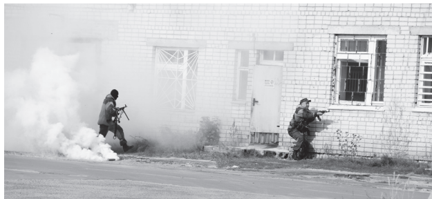
▲ Штурм больницы

25 сентября в Навашине прошли учения по пресечению террористических актов, в которых приняли участие представители оперативных штабов Нижегородской и Владимирской областей, ГУ МВД России по Нижегородской области, соседних территориальных органов внутренних дел и весь личный состав Межмуниципального отдела МВД России «Навашинский».