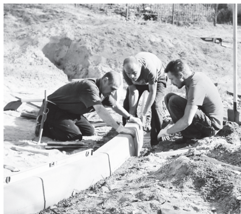
▲ Закладка фундамента

1 октября - Международный день пожилых людей