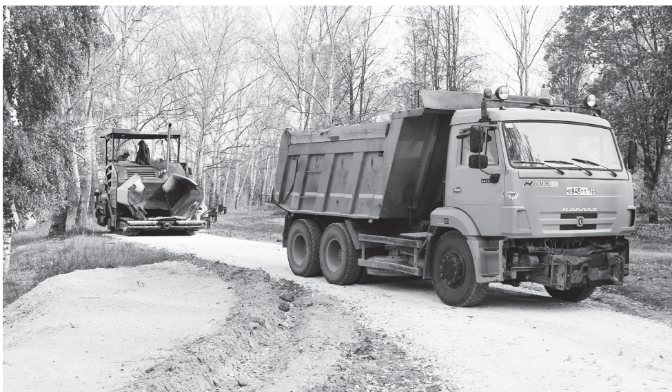
▲ Новые дорожки для прогулок