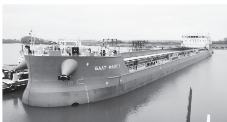
график платежей с учетом периода навигации и возможность досрочного выкупа предмета лизинга по истечении 84 месяцев», - говорится в сообщении ГТЛК.

«Согласно заключенным соглашениям поставки кораблей начнутся в 2016 году. Срок лизинга - 14 лет. Подписанный документ предусматривает сезонный