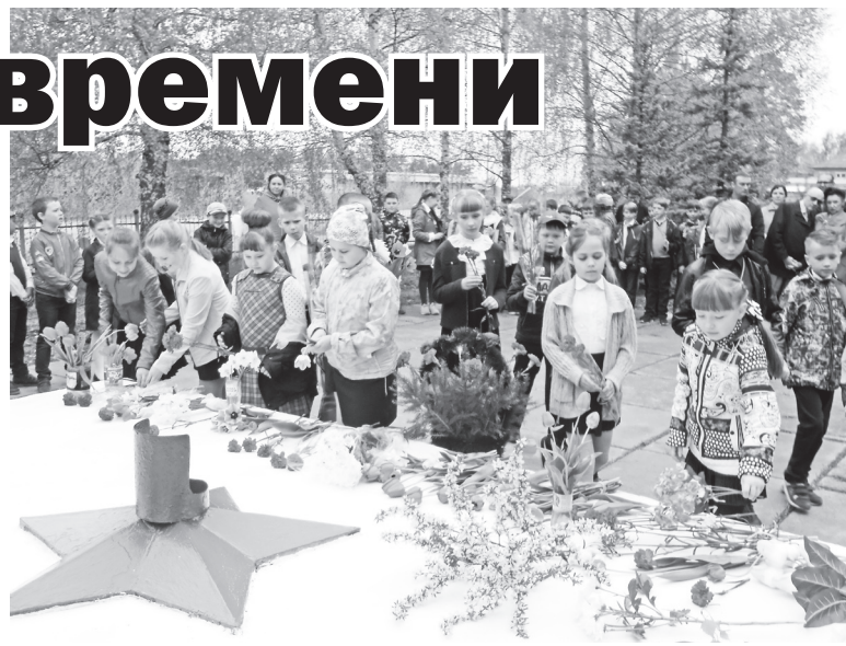
▲ У обелиска славы в п. Силикатный