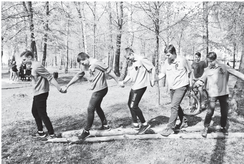
▲ Участники квеста проходят полосу препятствий

За прохождение испытаний на каждой станции команды получали пазлы, которые должны были собрать в финале мероприятия. Также они зарабатывали баллы. Наибольшее их количество набрала команда Большеокуловской школы, кото-