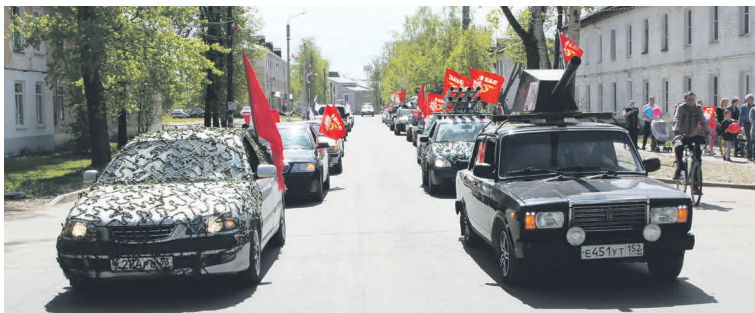
▲ Инициативная группа молодых людей-участников Автопробега - в автоколонне специально подготовленных к параду машин