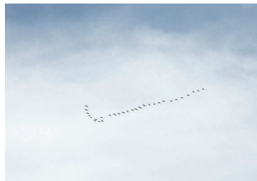
▲ Журавлиный клин пролетел над городом