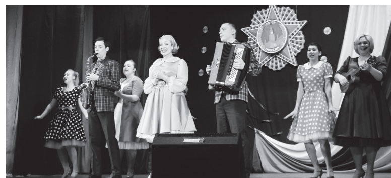
▲ Ансамбль народной музыки «Вишенка»