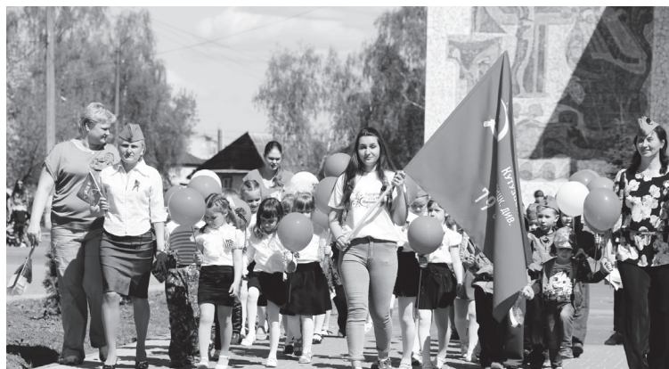
▲ Участники колонны Всероссийской акции «Эстафета поколений»