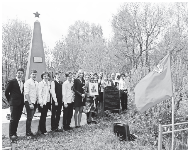
▲ В Монакове