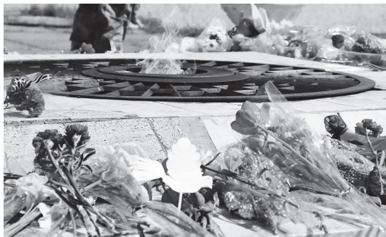
▲ «Цветы у Вечного огня как благодарность тем бойцам, что в армию тогда уйдя, за мир сражались до конца...»

В этом году почетное право несения «Вихты памяти» у обелиска Славы предоставилось военно-патриотическому объединению «Пламя» Большеокуловской школы.