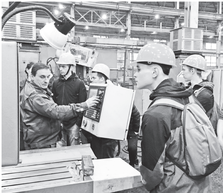
▲ Экскурсанты заинтересованно наблюдают за работой токарно-фрезерных станков с ЧПУ

Вместе со своими педагогами ученики 7–8-х классов