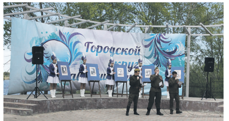
▲ Песня о танкистах