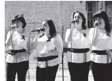
▲ «Народный» вокальный ансамбль «Акцент» исполнил песню «Катюша»

Так, 7 и 8 мая жители сел и деревень Угольного, Румасова, Левина и Гориц могли посмотреть захватывающее представление, танец «Вальс Победы» хореографического ансамбля «Экспрессио» Большеокуловского сельского Дома культуры, послу-