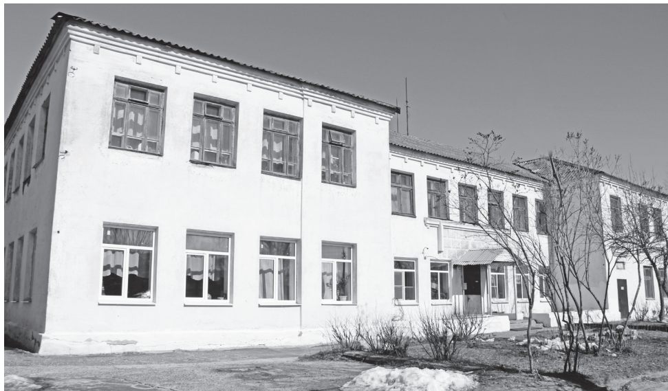
▲ Детский сад №1