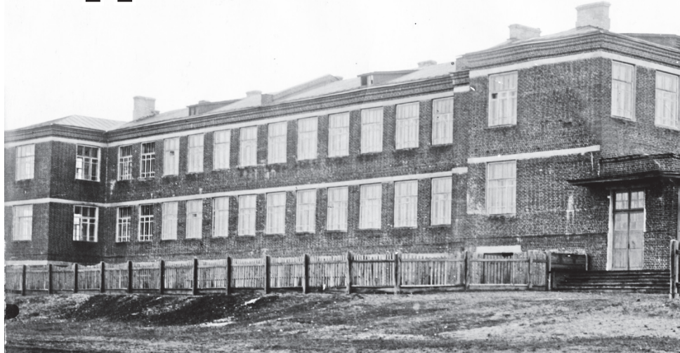
▲ Мордовщиковская средняя школа №1 (сейчас – гимназия)

Средними были школы в селе Монаково и Мордовщиковская № 1. Монаковская школа размещалась в старом деревянном