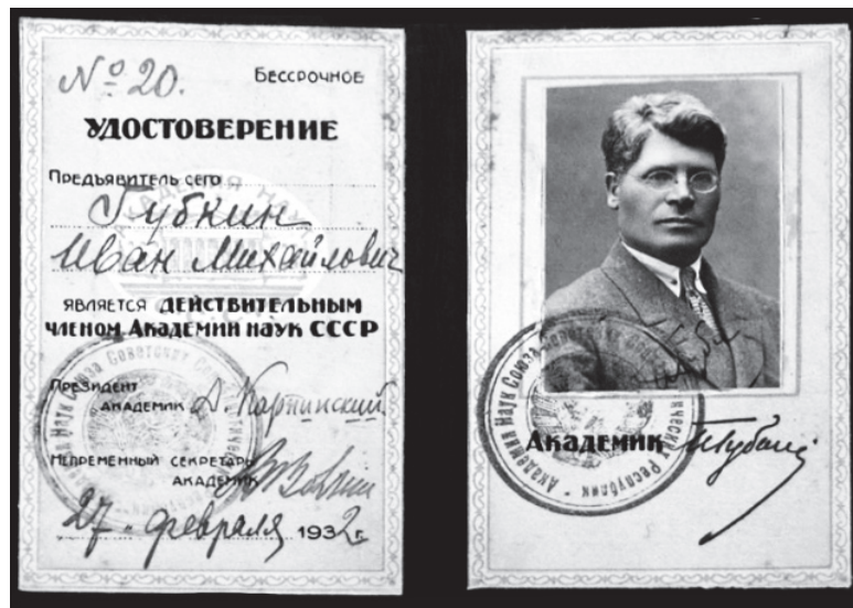
▲ Удостоверение академика

Его именем названы города Губкин в Белгородской области и Губкинский Ямало-Ненецкого автономного округа.