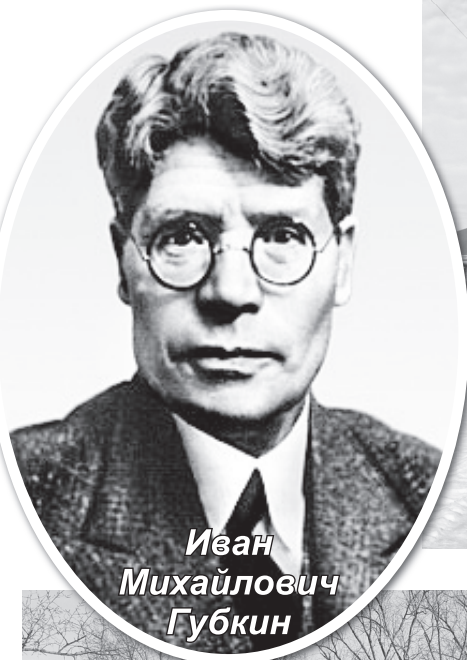
Иван Михайлович Губкин

Лауреат премии имени Ленина (1929 г.). Заслуженный деятель науки и техники РСФСР (1937 г.). Награжден орденами Ленина (1937 г.) и Трудового Красного Знамени (1939 г.).