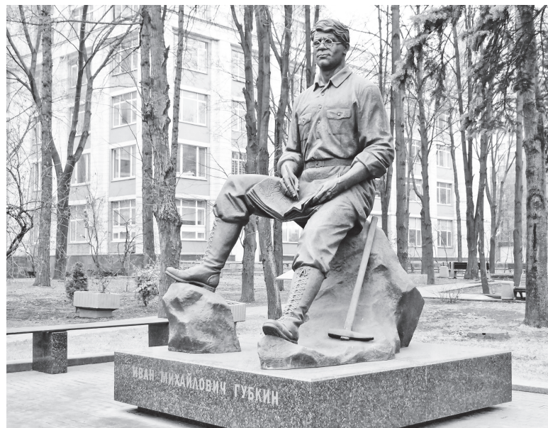
▲ Памятник И.М.Губкину перед зданием Российского государственного университета нефти и газа в Москве