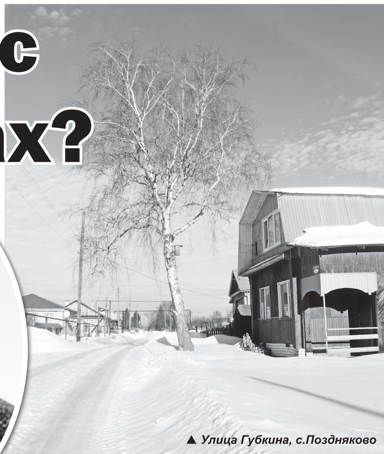
▲ Улица Губкина, с.Поздняково