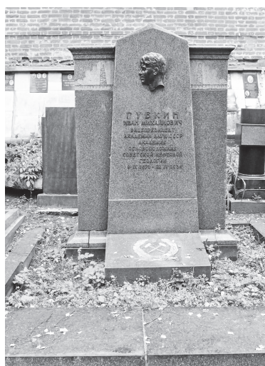
▲ Могила И.М.Губкина на Новодевичьем кладбище