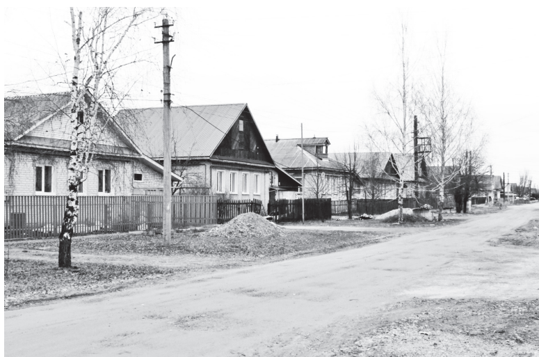
▲ Улица Губкина, г.Навашино