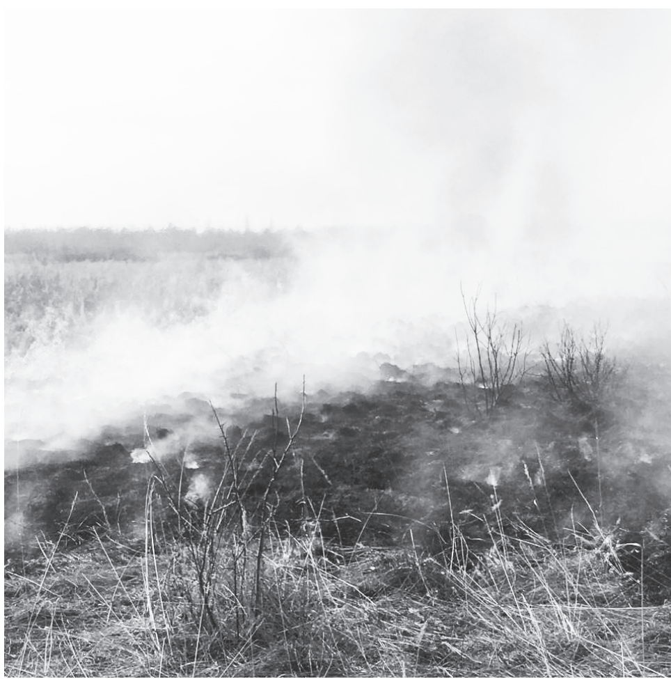
Поджог травы и сжигание мусора в необорудованных местах, согласно ст. 20.4 ч. 1 КОАП РФ, влечет наложение административного штрафа: – на граждан в размере от 1000 до 1500 руб. – на должностных лиц от 6000 до 15000 руб. – на юридических лиц от 150000 до 200000 руб.

К чему бы я это? А к тому, что мы не были вовлечены в виртуальную реальность, где так много всего удивительного и завораживающего. Нам в то время невообразимыми казались самые простые бытовые моменты. Так, моими любимыми детскими развлечениями были: походы с бабушкой в лес за грибами и за ягодами, стирка половиков и огородных пленок в пруду, прополка картофельного участка (ведь, благодаря этому, в борозде я впервые увидела ужа, жабу и прочих пресмыкающихся). Одним из самых ярких воспоминаний детства стала и возможность подолгу смотреть в окно автобуса, мчащего меня к любимой бабушке, вместе с которой я и открывала новые миры бытия.