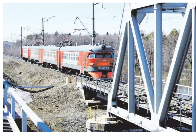
▲ Железнодорожный мост через реку Теша.

Мы продолжаем публикацию фотографий достопримечательностей города, его окрестностей, красивейших мест городского округа, присланных нашими читателями. Напоминаем: фото присылайте на электронный адрес: prpravda@mail.ru или приносите в редакцию (г. Навашино, ул. 1 Мая, д.6). Не забудьте написать название фотоработы (или что изображено) и автора.