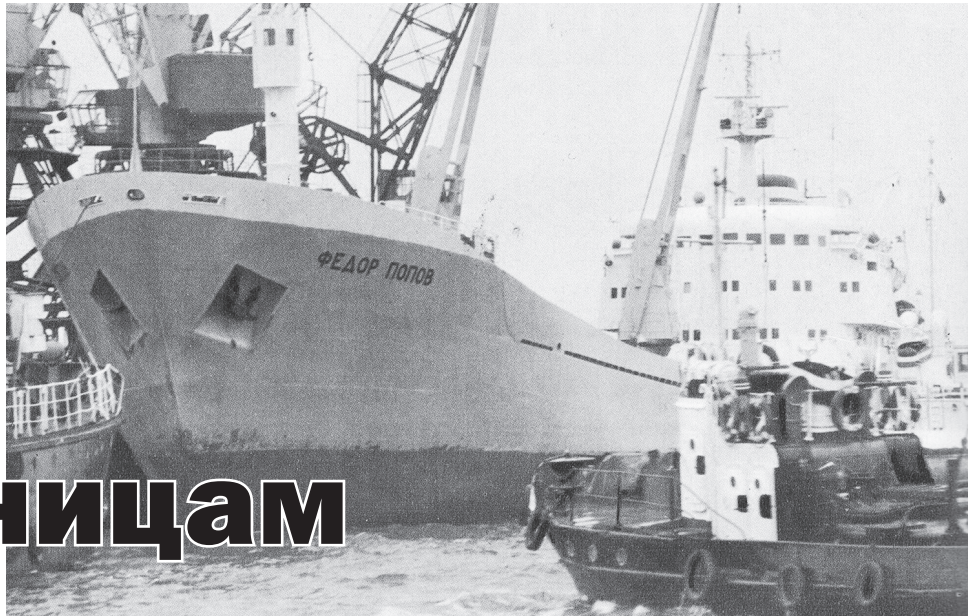
▲ Теплоход-сухогруз «Федор Попов». Накануне 1 Мая 1974 года отбуксирован с завода «Ока» на Балтику, где, пройдя окончательные испытания, отправился в порт приписки Тикси Северо-Восточного морского пароходства. Теплоход был списан в марте 2014 года

Очередной 1974 год район встречал очередными достижениями в различных сферах жизнедеятельности. И эти факты, безусловно, не проходят мимо журналистов. Большое внимание уделяется градообразующему предприятию – судостроительному заводу, немалую долю на страницах периодического издания занимают материалы, рассказывающие об успехах в сельском хозяйстве. Как и прежде в поле зрения мастеров печатного слова – объекты образования, здравоохранения. И об этом – буквально дословно.