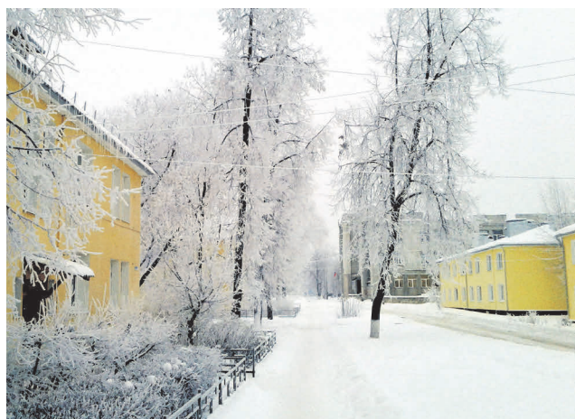
▲ «Иней лег на провода». Обновленная улица 1 Мая. Автор Эльвира Чернышкова