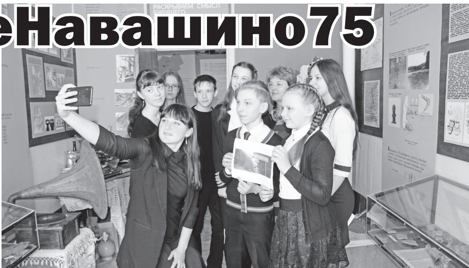
▲ Конкурс на лучшее селфи

Педагоги Дворца детского творчества провели квест-игру «История длиною в 75». Путешествуя по станциям «Вокзал», «Дворец спорта», «Деревня Волосово», «Дворец культуры», «Городской парк», «Дворец детского творчества» и «Озеро Святое Дедовское», ребята с удовольствием и неподдельным интересом участвовали в эстафете, викторине, мастер-классе по изготовлению сердца в технике оригами, побывали в роли актеров, инсценировав сказку-экс-промт, вспомнили правила поведения в железнодорожном транспорте, а также рисовали вокзал будущего, листовки в защиту сохранности объектов нашего парка и разучили с педагогом слова неофициального гимна г.Навашино. За