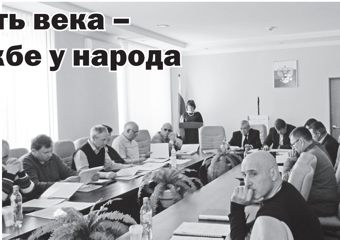
▲ На заседании Совета депутатов

В исключительном ведении Земского собрания находились такие вопросы, как утверждение местного бюджета и отчета о его исполнении; принятие планов и программ развития района, утверждение отчетов об их исполнении; установление местных налогов и сборов; установление порядка управления и распоряжения муниципальной собствен-