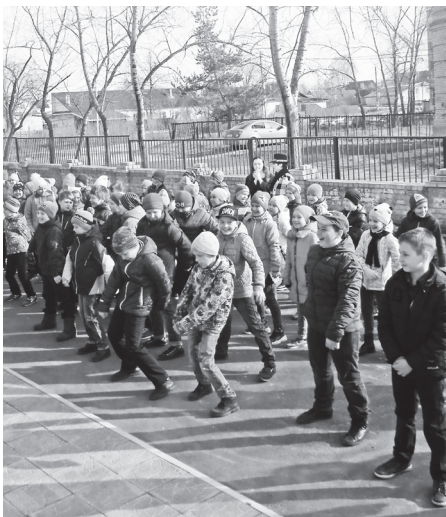
▲ 3-4 классы

Утром 8 апреля суэта и шум наполнили школьные коридоры: ведь зарядка стала для многих приятным сюрпризом и каждому хотелось поделиться новостью с одноклассниками и учителями. Веселая музыка, ритмичные движения и улыбки товарищей – что еще нужно для хорошего начала трудовой недели. Места под утренним солнышком хватало всем: у крыльца школы разместились