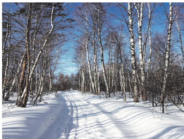
▲ Лыжня в лесу.