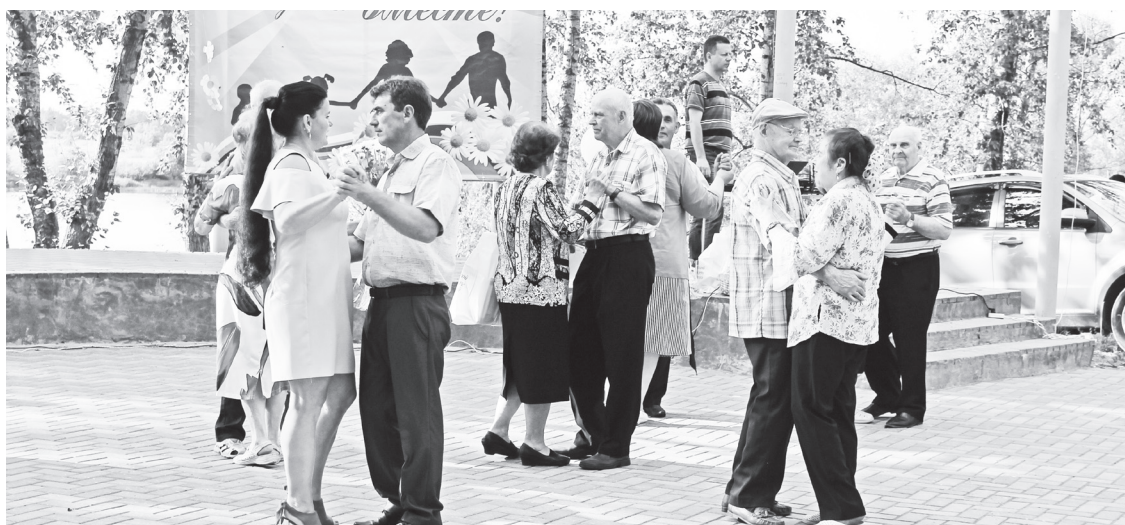
▲ Свадебный вальс