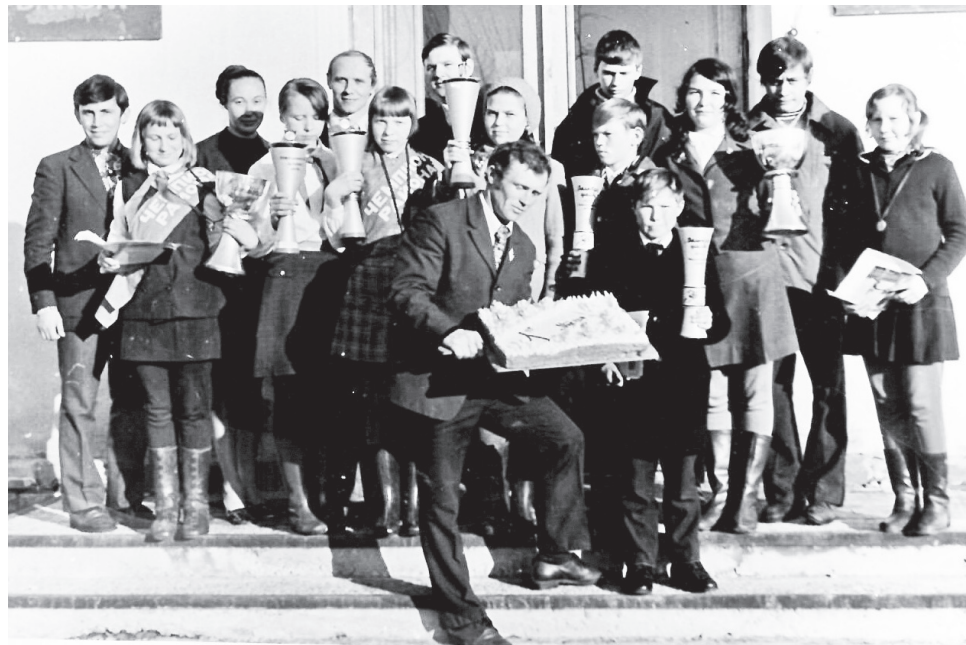
▲ Победители в зимних видах спорта - учащиеся школы №3 и Новошинской школы, 1976 год