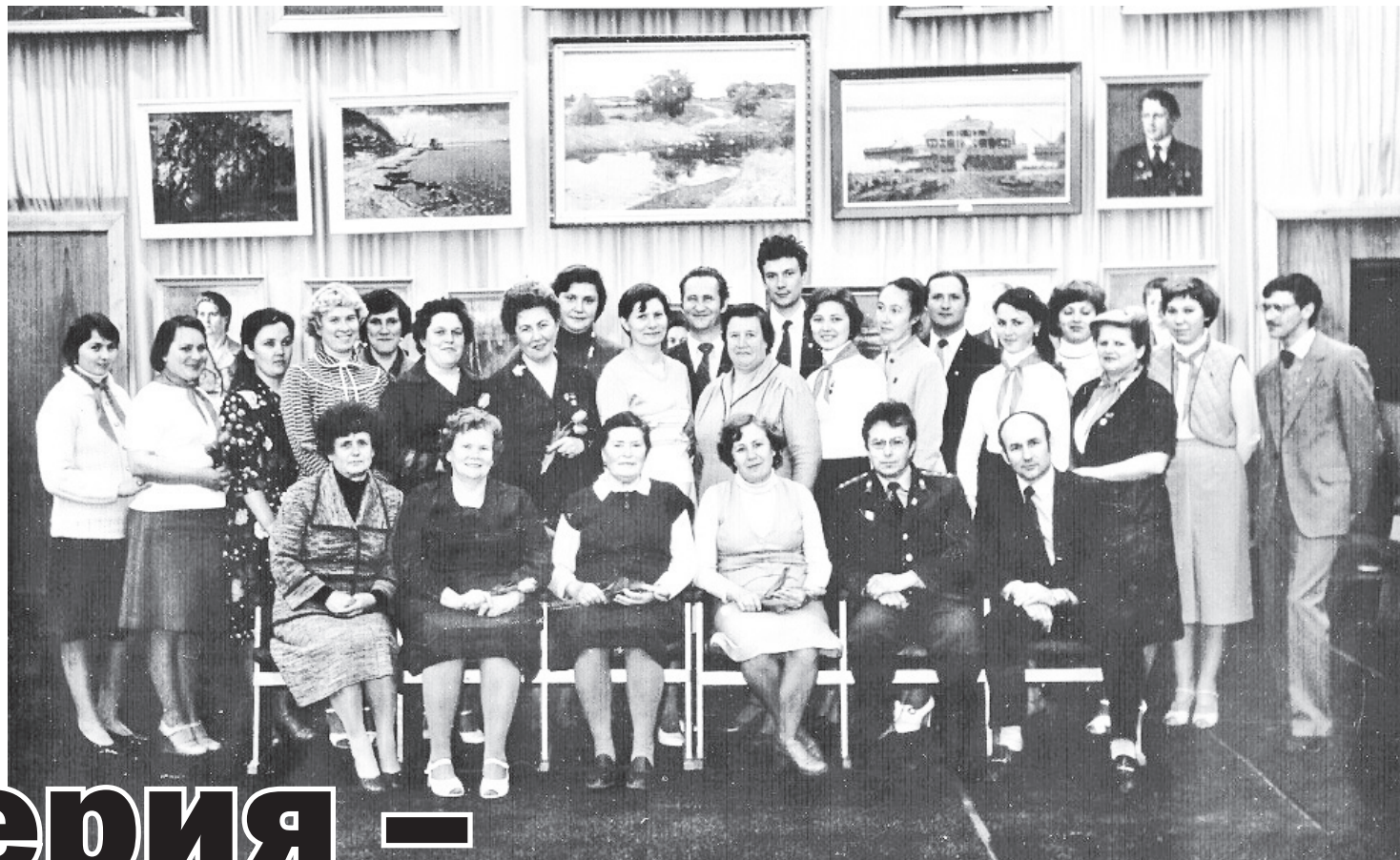
▲ Старшие пионервожатые и работники РК ВЛКСМ разных поколений, 1980-е годы