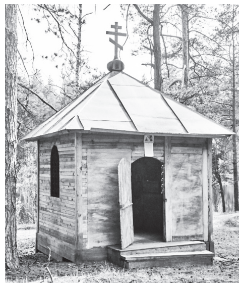
▲ Часовня храма Спаса Нерукотворного на берегу озера

Лето! Пора, когда многие уходят в отпуск, уезжают к морю, в санатории или на турбазы. Дети отправляются в лагерь, в деревни к бабушкам и дедушкам. Те, кто остаются, стремятся выехать из пыльного загазованного города хотя бы в выходные. Несмотря на некоторые капризы природы, навашиинцы продолжают с большим удовольствием посещать местную достопримечательность – озеро Святое Дедовское.