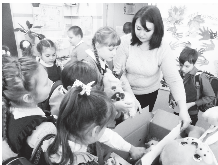
▲ Игрушки для ребят готовы