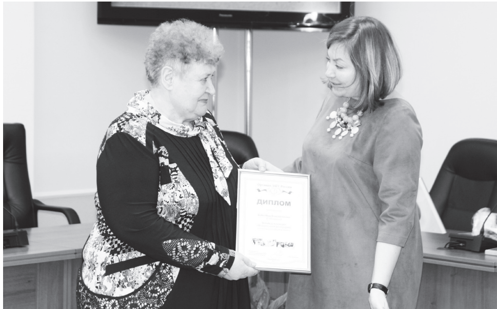
▲ Церемония награждения

Вера БОЙКО, Ирина РЯБУШЕВА