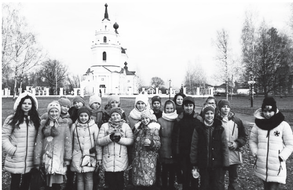
▲ Юные паломники в Большом Болдине

Духовно-просветительское и образовательное значение паломнических поездок по святым местам очень важно, потому что ребятам была предоставлена возможность не только расширить свой кругозор, но и узнать, наследниками какой богатой духовной культуры мы являемся, зримо приобщиться к ее бесценным сокровищам и традициям.