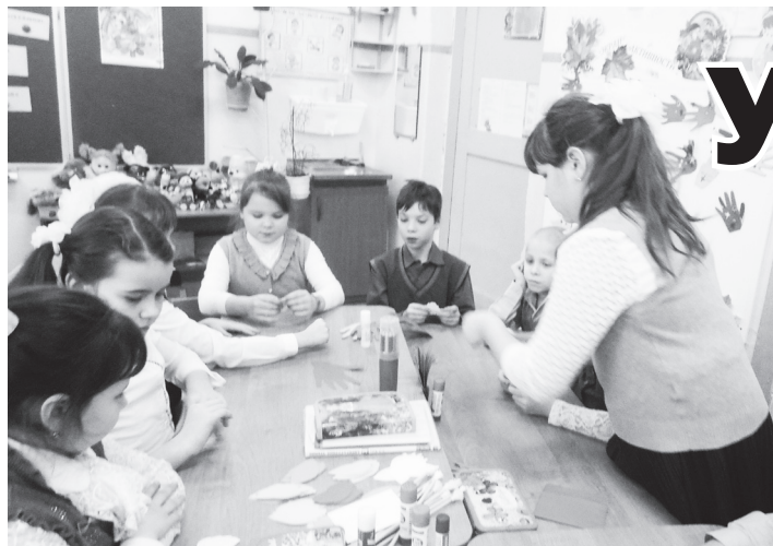
▲ Работа в команде