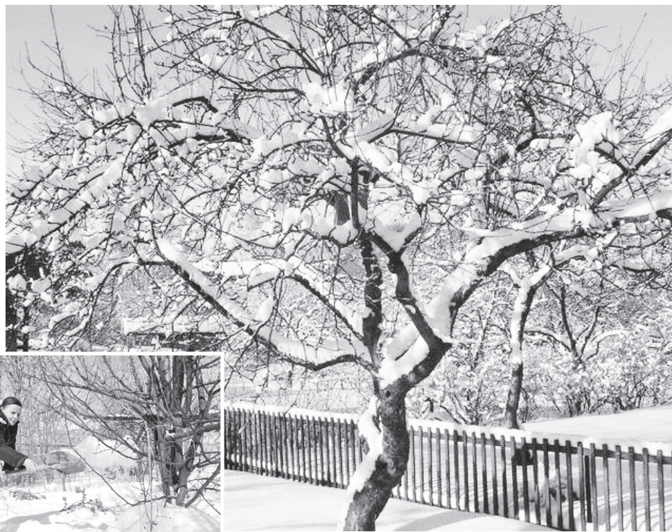
▲ Регулярно сгребайте выпавший рыхлый снег с дорожек, крыши, междурядий сада и перекидывайте под кроны деревьев