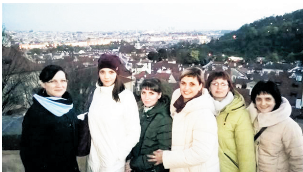
▲ Участники поездки

– Мы поняли, что идем в ногу со временем и в Навашине в плане работы нашего магазина все ничуть не хуже. Конечно, мы отличаемся от европейцев: там нет такого привычного для нас хлеба, как, например, буханок или батончиков. В их магазинах продается в основном сдоба, булочки, круассаны. Магазин открывается в 8 часов утра, и вся выпечка уже готова – мы чувствовали ее запах на улицах. Заметили мы и такое различие, как отсутствие замороженных продуктов: рыбы, мяса, овощей. Нас удивило то, что готовят местные жители мало.